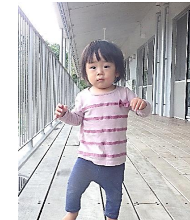
歩くのが上手になってきました。