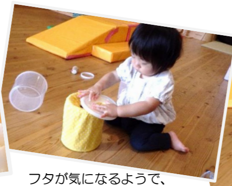
フタが気になるようで、 いろいろ試しています。