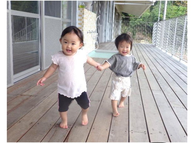
5歳のお姉さんと、歩こう♪