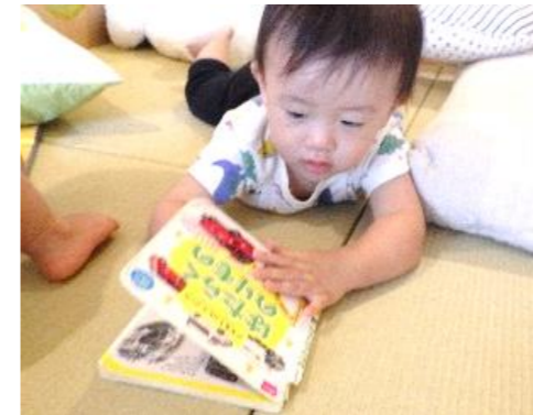
腹ばいで遊んでいます！