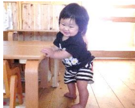
つかまり立ちをするのが楽しい！