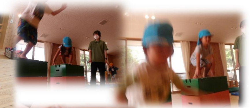
～巧技台からジャンプ～

お約束は・・・ 「お友だちを押さない!!」 全身をつかって体を動かし 楽しみました😊