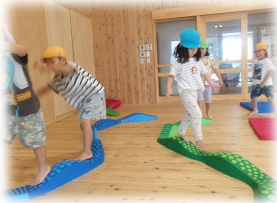
～バランスをとって渡ります～