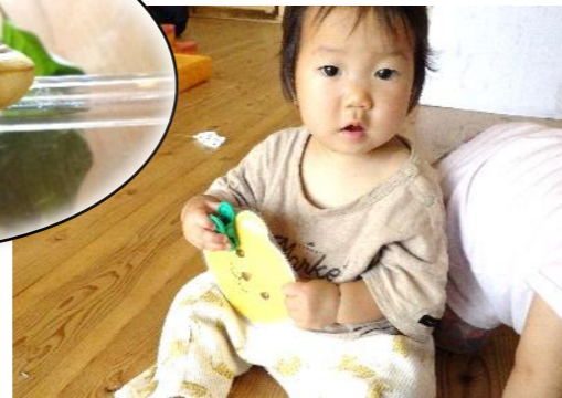
洗濯ばさみに興味が出ています