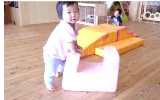
高ばいが多くなり、押して歩くのが大好きです。