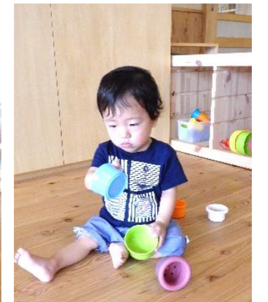
とても集中しています。座り姿勢が安定したことであそび方が転がすから重ねるに変化してきました。