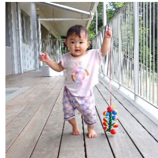
一週間で歩行が多くなり、はいはいが少なくなりました。手に持って歩行します。おでかけするのが楽しいようです。