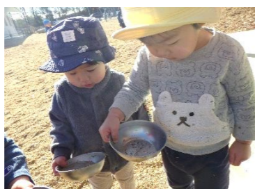
氷をお皿に入れて揺らすと…？ カラコロン♪と音が鳴るのを 楽しんでいました。