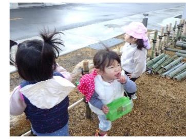
鳥さん逃げちゃうから 「しーーーーっ！」