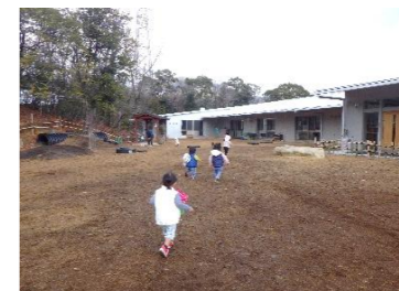
「まてまて～!!!」 園庭の端から端まで 鳥を追いかけ元気に 走っていますよ♡