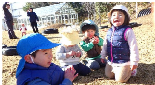
ゆーきがふってきたチャチャチャ！