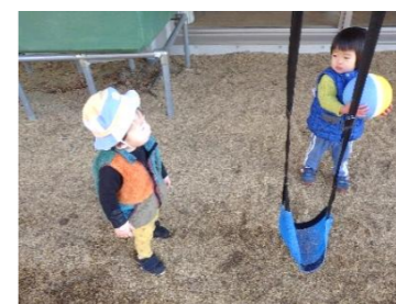
”ブランコかわって”とお願いすると 代わってくれたお友達♡ 「ありがとうだね」と保育者が言うと 「ありがと」「いいえ」のやりとりが