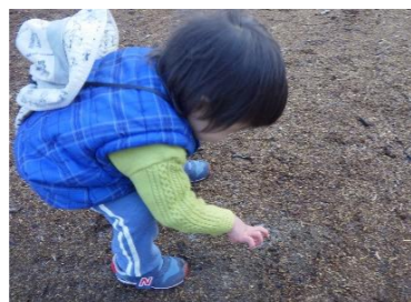
園庭の地面が凍ってる?! 触ってみると…「つめたい！」 他のクラスのお友達や先生にもみてみて! と教えていました。