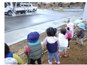
こどもたちの 視線の先には…? 鳥さんがいます