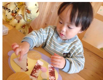
③ひっくり返して…べたり！ 貼った後、剥がれないように しっかりと手や指で押しつけていました。 塗り広げたり、手にも付けたしなが らの感触も楽しんでいました😊