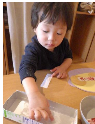
①人差し指👉にのりをつけて…