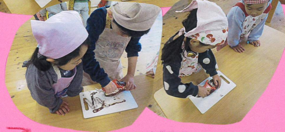
おぼろは「おぼろ」 皮をむきます!!