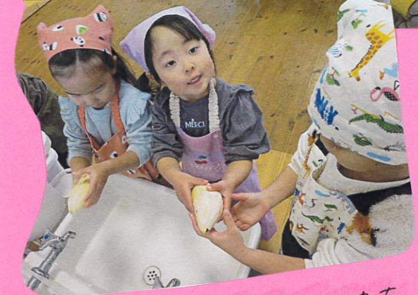
おぼろは「おぼろ」を キレイに洗います!!