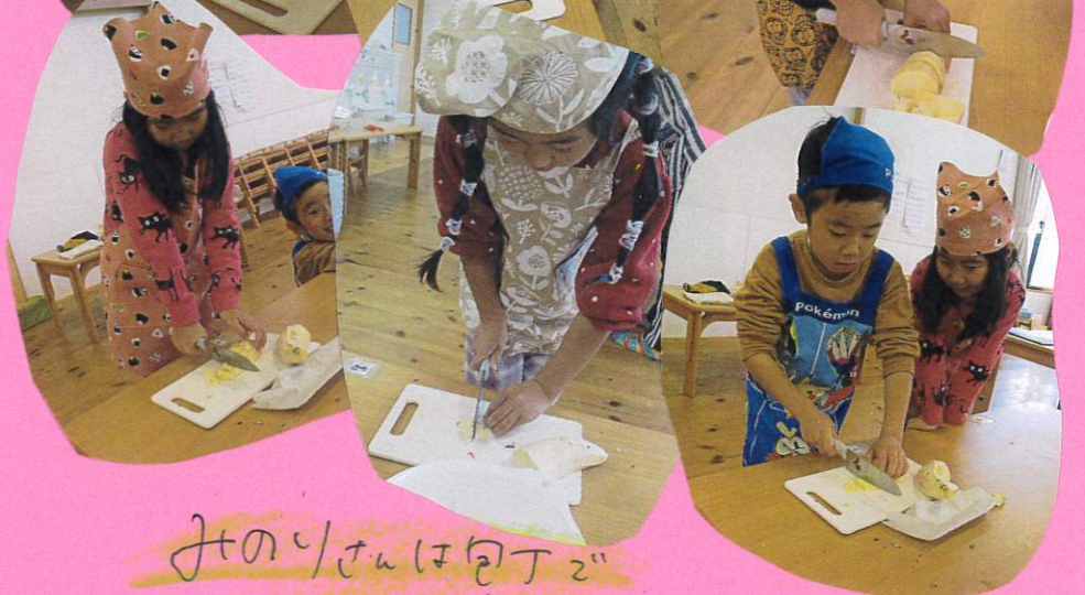
おぼろは「おぼろ」 「おぼろ」に!!