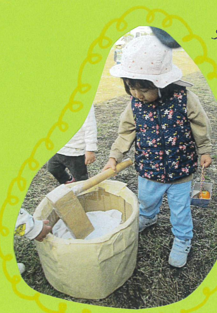
片手で 余裕のあるつきっぷりです♡