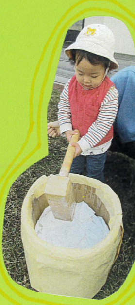
よいしょ ちょっと重い...?