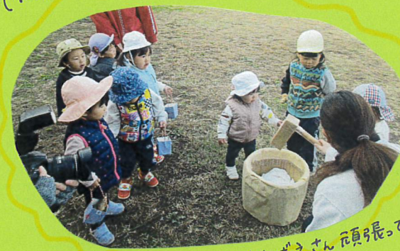
(めばえさん頑張ってるP)