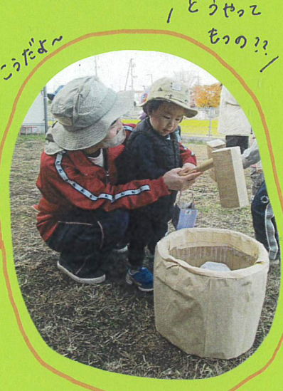
どうやって もつ?? こたよ~