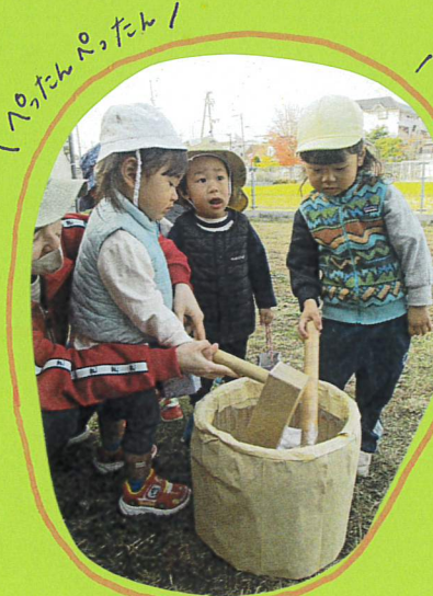
へったんへったん!