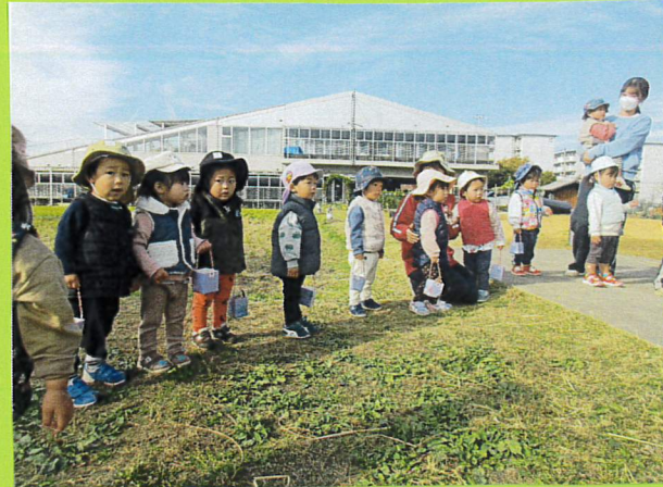
(わあ、めばえさんもしてる)