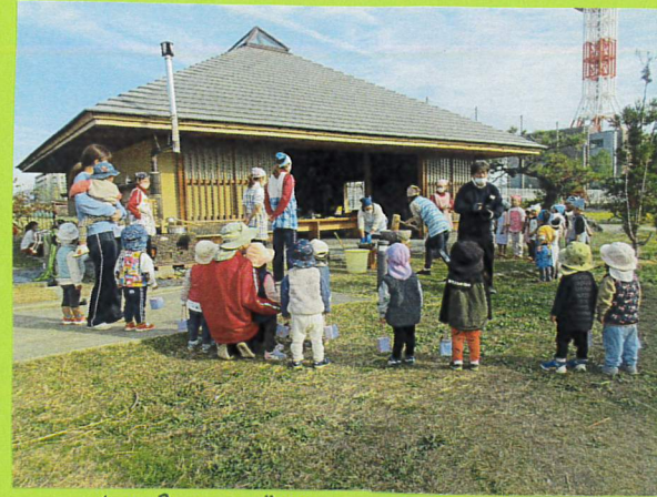
幼稚園さんがやっているおもちつきを、みんな口が開いたまま見ていました(笑)