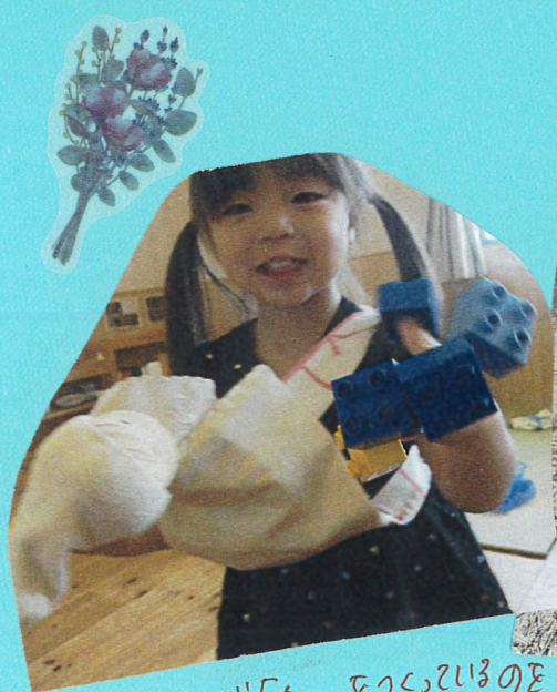
あともたけが「カニ」をくわえのを見て 「わたし! カニさん」としっぽ!!