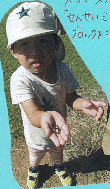
火田で"見つけたミズ"を 「せんせいミズ」おつけて!と教えなくて中々、 ブロックを指しはめて、「カニさん」と見せて くれました!