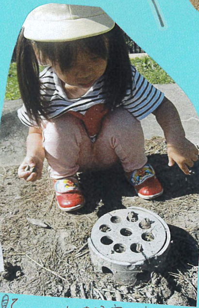
小さな穴の中に、小石を 入れていました!