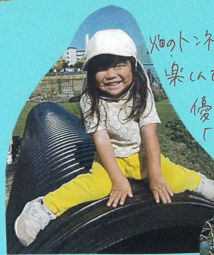
火田のトンネルの上に座り、景色を見て 楽しんでいました! 朝顔の花を見て 優しく、ツンツンを触って、 「きれいね」と うっとり!!