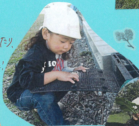
穴の中に小石を 入れて、しっぽ を入れて、遊んで いました!