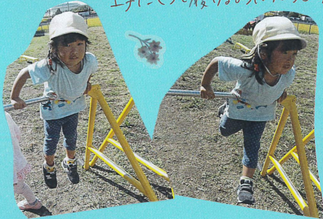
鉄棒にのり、足をバタバタと 自転車こぎに挑戦していましたよ!