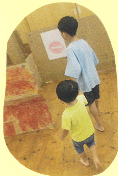
宝物はどこかなあ？