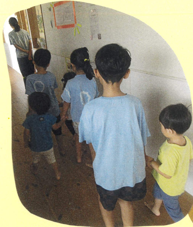
一緒に手を繋ぐ姿がとっても可愛いかったです♡