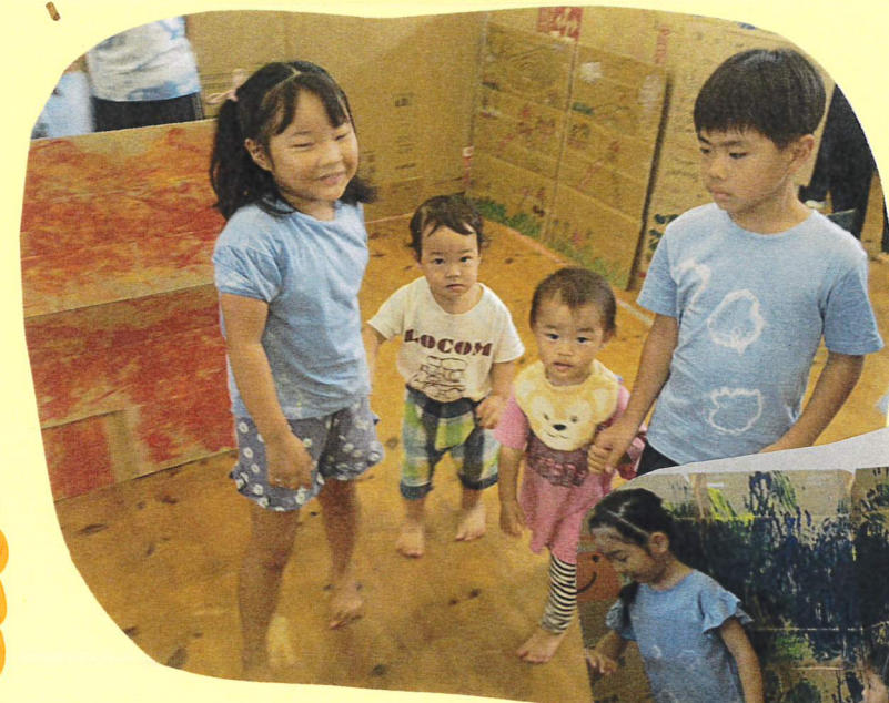
ドキドキ♡わくわく♡中はどんなふうになっているんだろう...？とキョロキョロ周りを見ながらズンズン進んでいました♡