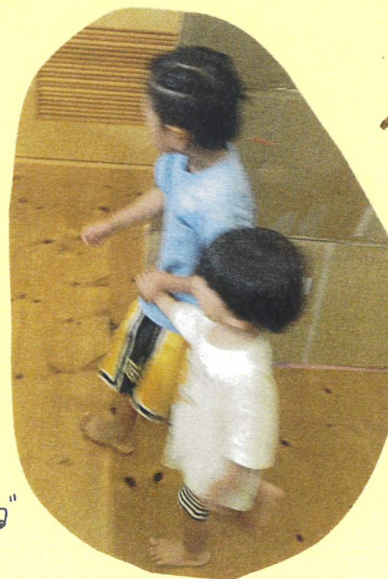
あっち行ってみよう！！