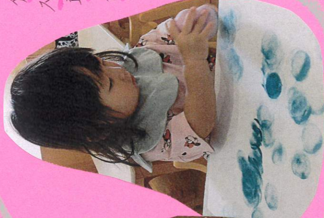
優しい高達 スタンプ！画用紙の 端打ぐ、とき 伸ばして戸陽マア 色をのせてほしい！