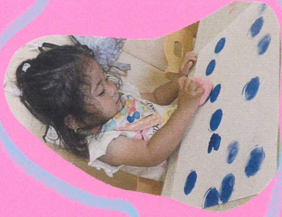
スタンプが重なりないうちに 色々な所へスタンプして いました！「わぁ〜！」と 驚きながら真剣な 様子です。