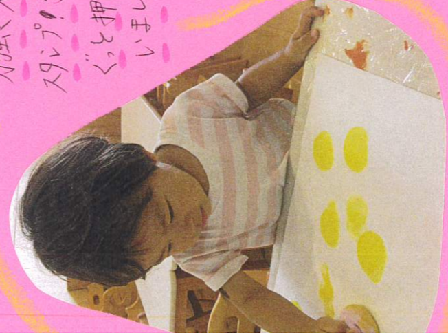
力強くスポンジを押して スタンプ！手あががあるの ぐと押し込んで いました。ご