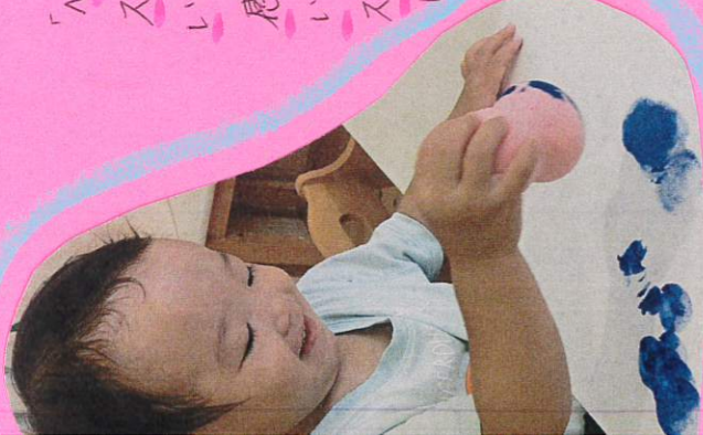
「パパタ」と言いながらスタンプを押して いました。ごちそうの 感覚が気持ち いいかまじ スタンプをして いました！

水を念入りにやみ流めにくくして毛布のスポンジを使い、スタンプをしてみました。♪フワフワボケと弾加のゆるスポンジ！力強く押してみたり軽くトントン色もフワフワと色んな方法でスタンプしてみました。 R6.7.23