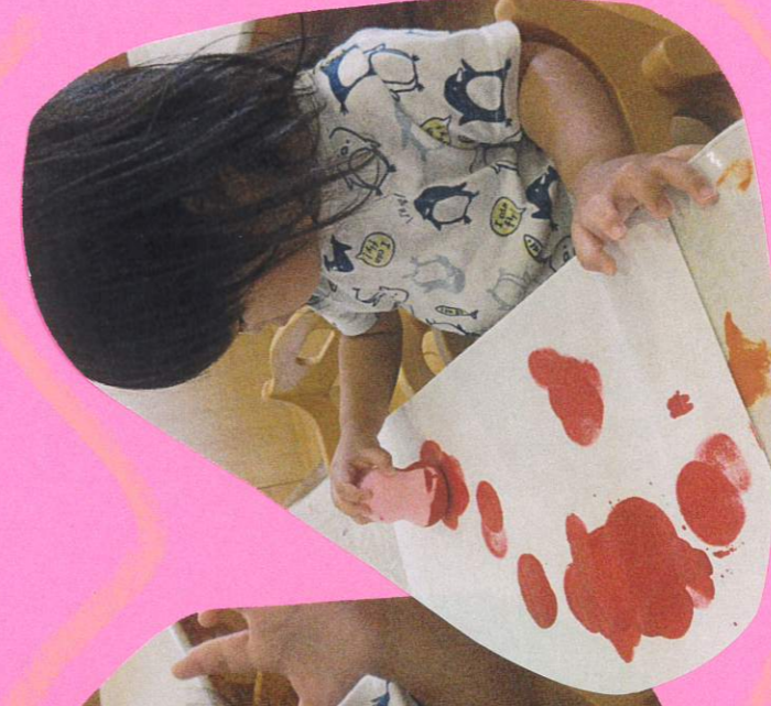
パパタと高達 スタンプ！あー！ 「あー」と声を 出して楽しんで くれました！