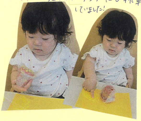
指でも押ししてみよう!!

絵の具が「気にな」り指で感触って確かめていました! その後指スタンプにも挑戦していました!