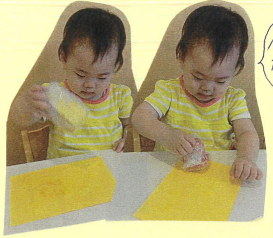
パッパッ! たのしいね

一度スタンプの方法を知るとすごい早さで押し楽しんでいました! 完成すると「おお〜!」と嬉しそうに声を上げていましたよ!