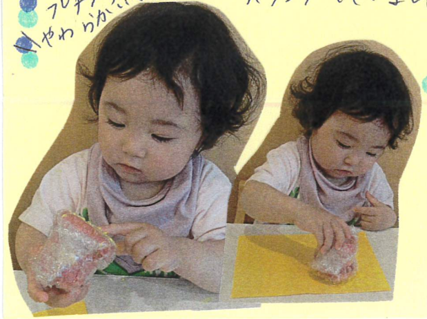
フチフチの感触がやわらかい!!

まずは手で感触を確かめ保育者にスタンプの見本を見せてもらおうと上手に真似をして何度もスタンプしてましたよ!