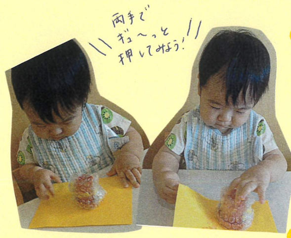
両手でギュッと押しみよう!!

スタンプを押し出す時糸も一緒に持ち上げてくれました! 沢山押しした後絵の具が「気にな」り指でチョンチョンと感触を確かめて楽しんでましたよ!