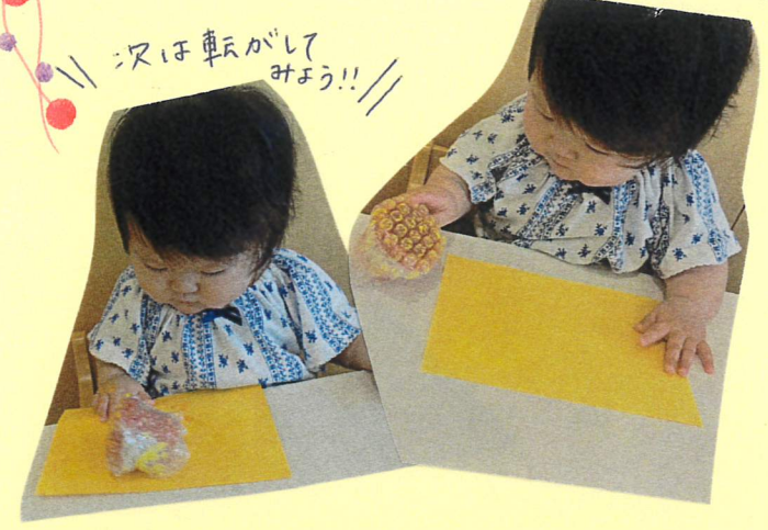
次は転がしてみよう!!

コロコロと転がすようにスタンプをしたら、ギュッと上から押しつけた様子は方法を楽しんでいましたよ!