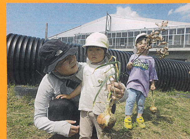
「おとうさんにあげる」とたまねぎを持って、おとうさんに挨拶していました!