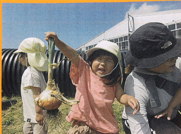
「ヤッター たまねぎだよ〜!!」