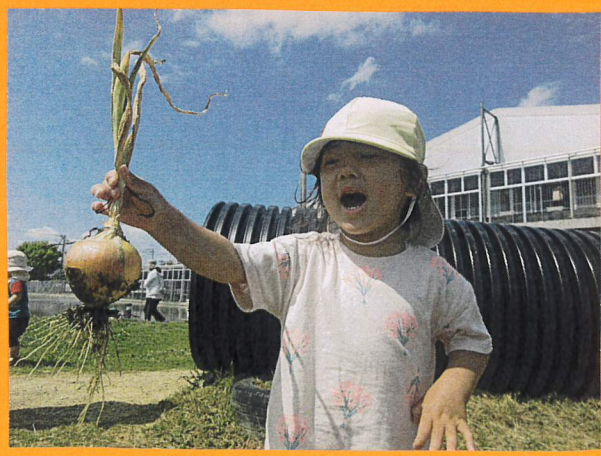
「ととだよ〜!!」「かいらいだよ!!」