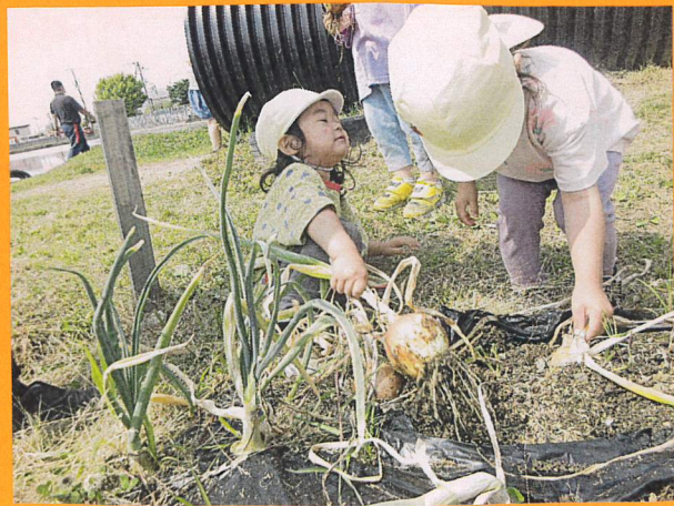
「うんとこしょ〜!! たまねぎぬけたい〜!!」