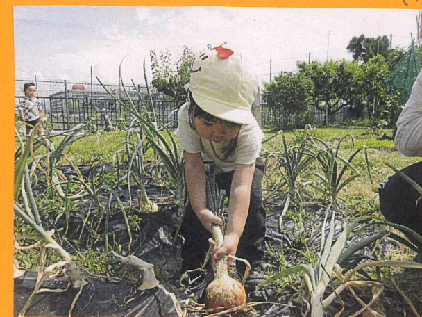
両手でしっかり持ってもなかなか抜けない!! 「せんせーでつた〜」と元氣張っていました!