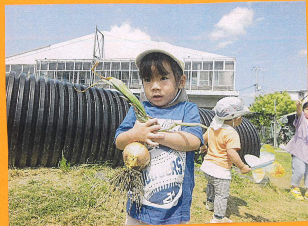
「これはおたしのたいじだよ〜!」