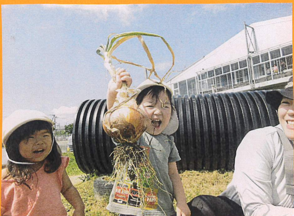
「いっせー!! おおきいのぬけた!!」