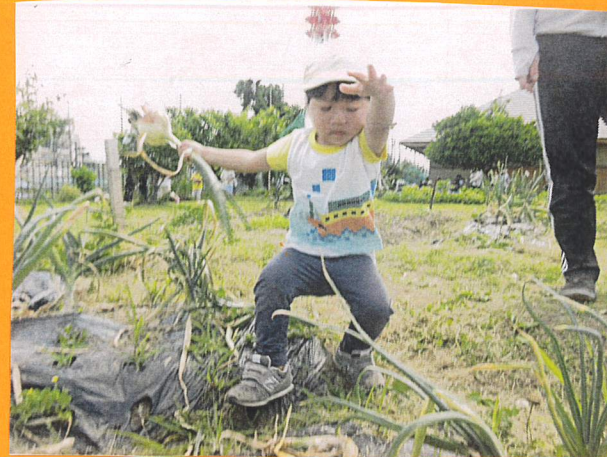
「あ、とと!!」と叫び、はらい取ったのがよくわかります!!